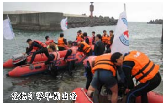
發動引擎準備出發