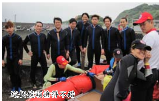
這個鏡頭搶得不錯