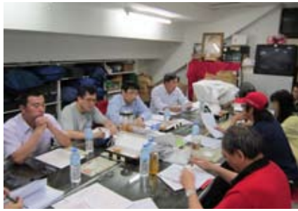
各期救生班總教練齊聚一堂