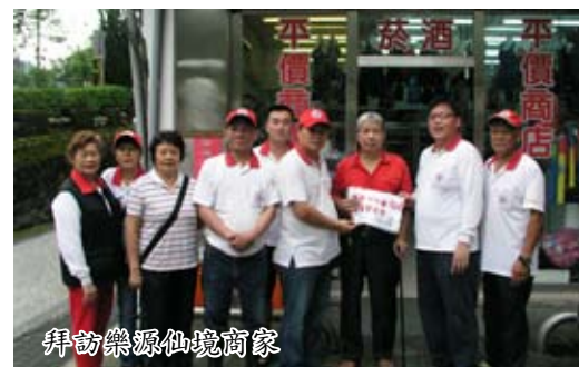
拜訪樂源仙境商家