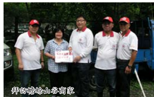
拜訪蟾蜍山谷商家