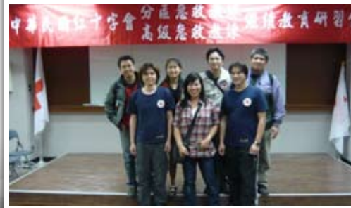
急救教練繼續教育