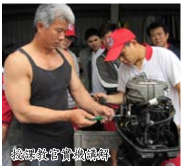
授課教官實機講解