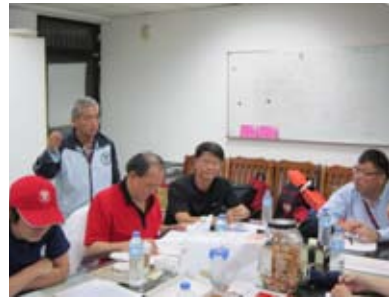
救生班總教練開班協調會