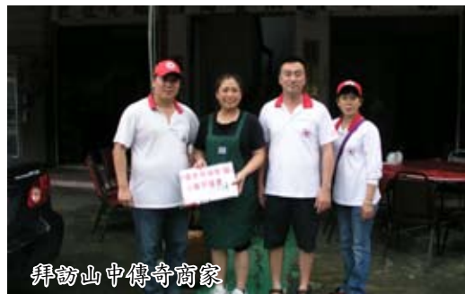
拜訪山中傳奇商家