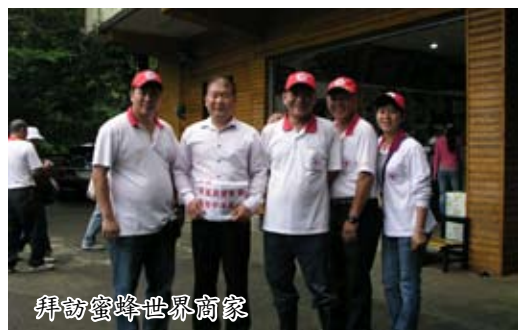
拜訪蜜蜂世界商家