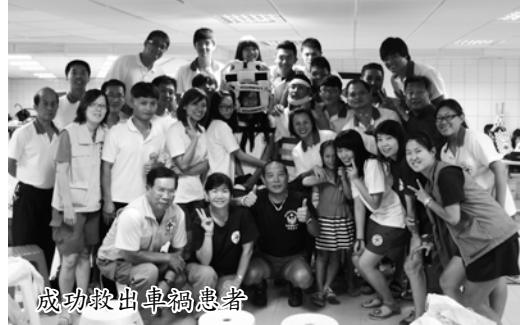
成功救出車禍患者