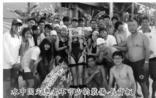
水中固定患者不可少的裝備-長背板