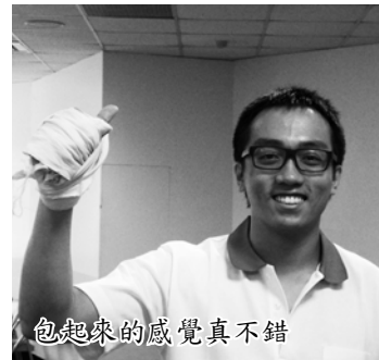
包起來的感覺真不錯