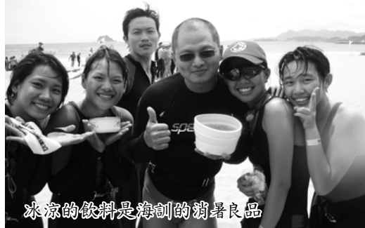
冰涼的飲料是海訓的消暑良品