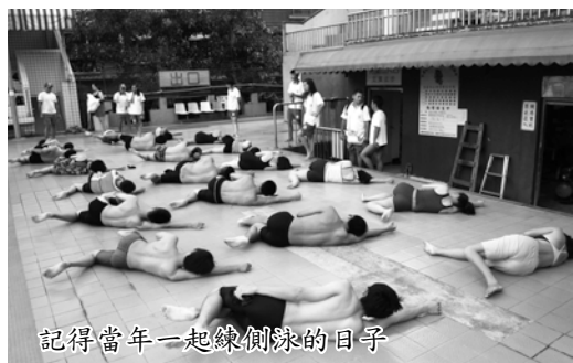
記得當年一起練側泳的日子