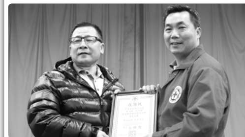
感謝學寶實業南順興總經理