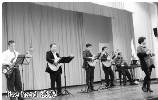
live band 演奏