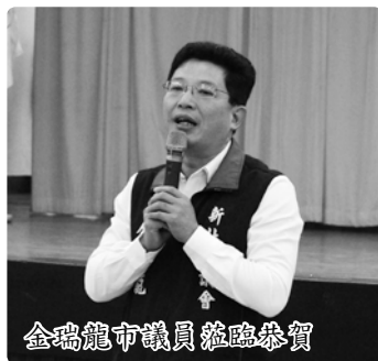
金瑞龍市議員蒞臨恭賀