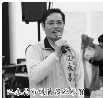
江永昌市議員蒞臨恭賀