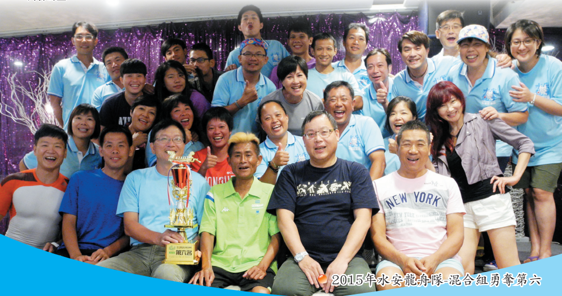
2015年水安龍舟隊-混合組勇奪第六