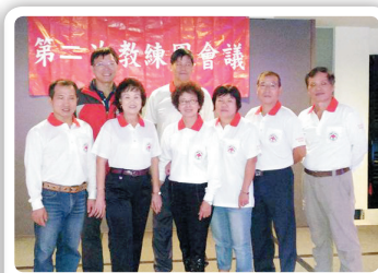
104年水安第二次教練團會議