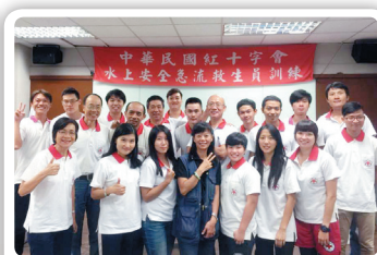
總會急流救生訓練