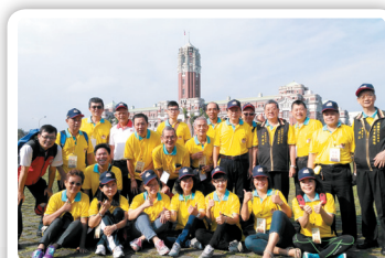
水安隊員支援城隍爺繞境公差