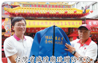
台灣省城隍廟致贈防寒衣