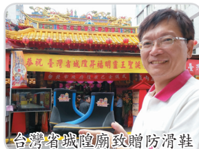
台灣省城隍廟致贈防滑鞋