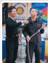
水安搜救隊受邀演講