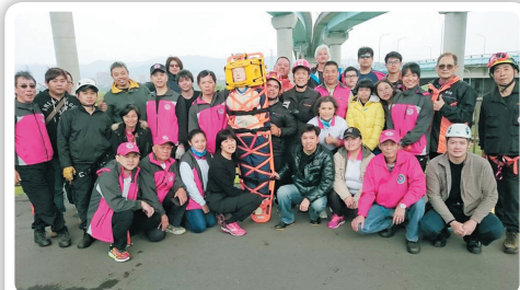
水安搜救隊聯合演練

紅十字總會新北市水上安全工作大隊 紅十字會台北市分會水上安全工作大隊 新北市救護員教育服務推廣協會 中和區體育會游泳委員會自強旱泳會 聯合會新春團拜