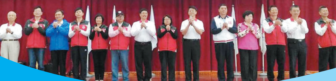
● 105年水上安全工作大隊新春團拜

紅十字總會新北市水上安全工作大隊 紅十字會台北市分會水上安全工作大隊 新北市救護員教育服務推廣協會 中和區體育會游泳委員會自強旱泳會 聯合會新春團拜