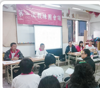
第一次教練團會議