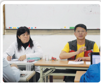
三月份幹事部會議