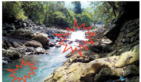
蜜蜂世界往上原龜形石的下游處有一小小深潭，上方的落差瀑布水流強勁，水深亦達2米以上應勸阻遊客勿前往靠近。