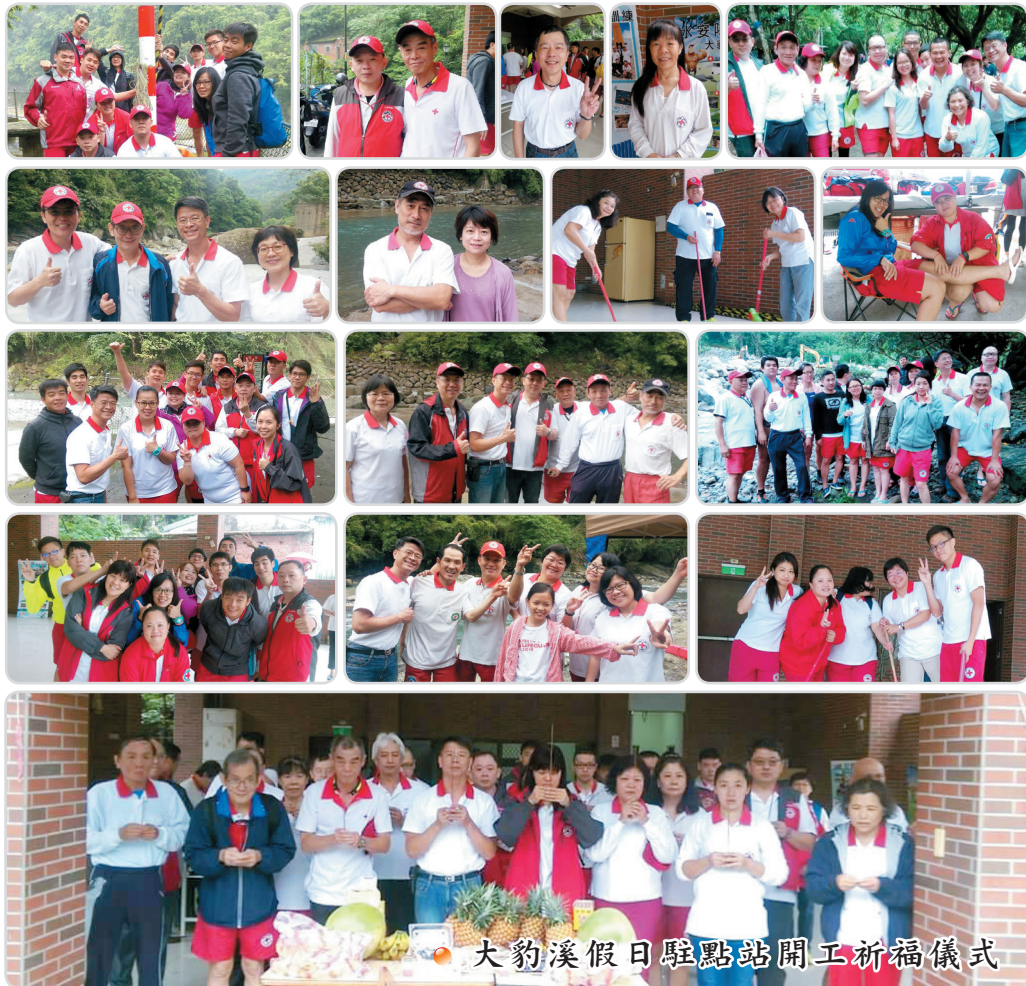
大豹溪假日駐點站開工祈福儀式

紅十字會總會新北市水上安全工作大隊 發行單位：紅十字會台北市分會水上安全工作隊 聯合會 新北市救生員教育服務推廣協會 中和區體育會游泳委員會自強早泳會