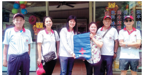
拜訪商家-蟾蜍山谷