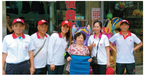
拜訪商家-樂源仙境