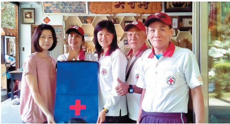
拜訪商家-蜜蜂世界