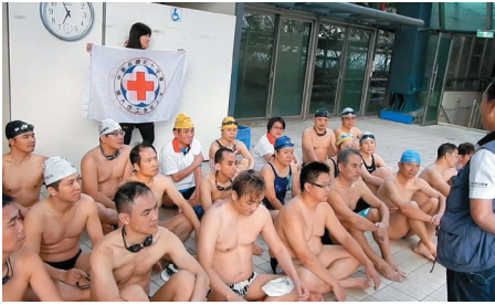
日理萬機的總幹事，都要親下做人型看板了。