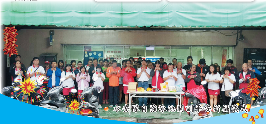
水安隊自強泳池開訓平安祈福儀式