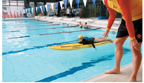
教學的各式設備都應完備方能進行訓練。