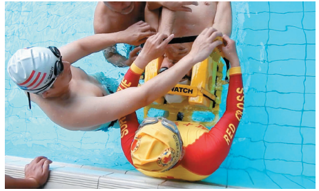
學員們正確且精實的練習，正是教練團用心的結果。