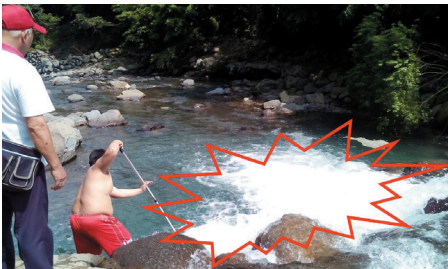
去年颱風過後，水文狀況驟變，山中傳奇之右岸中坑溪因崩壞嚴重河道整治中，下游處瀑布深潭經探勘有2米以上需注意。