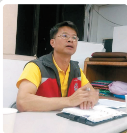
四月份幹事部會議