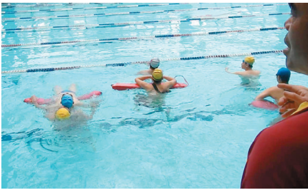
一個口令一個動作，確實做到位才可以在急難時有充足的信心。