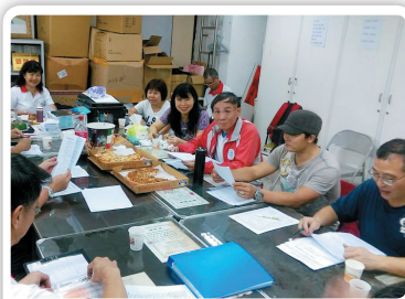
救生班總教練協調會