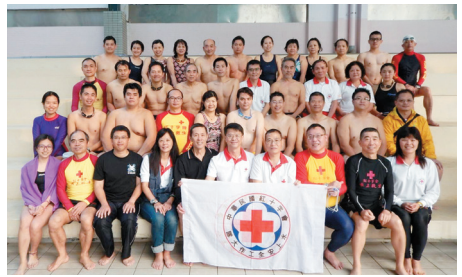
成功的結束，不是結束，而是水安訓練的開始！