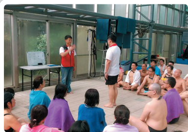
水上安全救生課程統一研習營105年度水安先期訓練