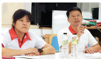
九月份幹事部會議