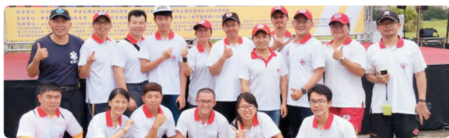
水安急救組支援「榮耀九三」全民路跑嘉年華