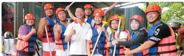
水安機動組梅姬颱風備災