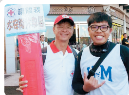
日月潭國際萬人泳渡