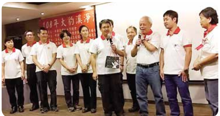
在大板根與會員分享事發歷程