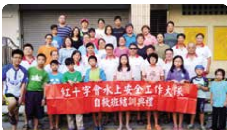
中和國中自救二燕睿成總教練