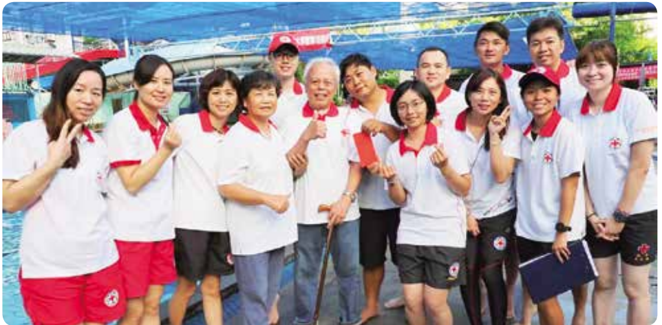
今年8月回到水藍天泳池與大家合影