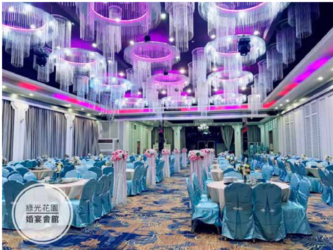
綠光花園 婚宴會館