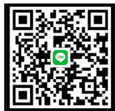
Line QR code