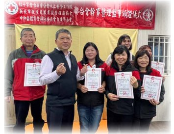
新北市水上安全工作大隊